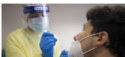
Il numero dei tamponi positivi continua a crescere ogni giorno

di martedì mentre nel solo territorio di Ats Brescia i contagiati da inizio pandemia sono 20320 con 13411 guariti. I decessi salgono a 2755 compresi i 203 della Vallecarnonica dove i positivi sono stati 47 in 24 ore per un totale di 2351. A Brescia città sono 1311 nuovi casi mentre c'è da registrare il dato anomalo di Roè Volciano che nelle ultime ore ha visto un picco con 23 nuovi positivi.