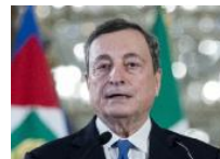
Mario Draghi, il premier incaricato

Il perimetro dei sostenitori si amplia, la strada per un governo Draghi si fa meno stretta. Dopo il Pd e Iv, pure Forza Italia dice sì a un Esecutivo guidato dall'ex banchiere centrale. Anche una parte della Lega vorrebbe appoggiarlo. I 5 Stelle restano un rebus nonostante le dichiarazioni concilianti dell'ex premier Conte. PAG 2-3